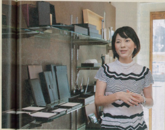
山川社長は大阪府生まれ。ミニコミ誌編集部などを経て、1990年にイヴレスを創業。中国・青島にも拠点を持つ

非日常の空間を演出するこだわりの備品をホテルに提供する。企画から製造、コーディネートまで一気通貫で手掛けることが強み。女性らしい細やかな視点も強力な武器となっている。 文 萩島央江