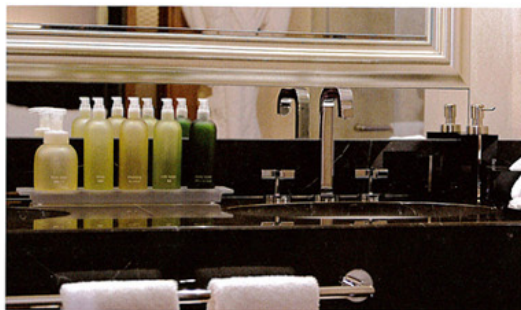
左：搾りガラス風レジン製ボトルとトレーのセット 右：漆器調レジンフォーマーボトル レジンは様々な表現が可能な素材で、絶妙な色合いのグラデーションは、この素材ならではの。

〒540-0038 大阪市中央区内浪路町1丁目3-2 TEL.06-6944-1411 FAX.06-6944-1400 http://www.ivresse.jp/