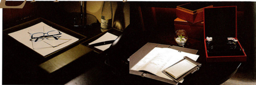
オリーブグリーンの本革でしつらえた、ステーションナリーセット 左上：レタートレイ 中央：リモコン収納 右上：メモトレイ