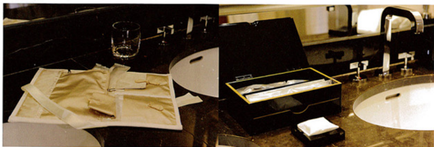
インナーにゴールドサテンを使用した、レディースアメニティポーチ。表地はキャンバスで、オリジナルモチーフの総刺繍を施してあります